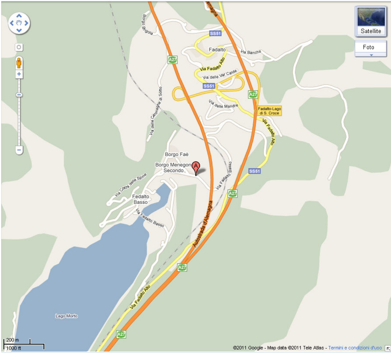
Localizzazione di Fadalto – Frazione di Vittorio Veneto (Treviso)